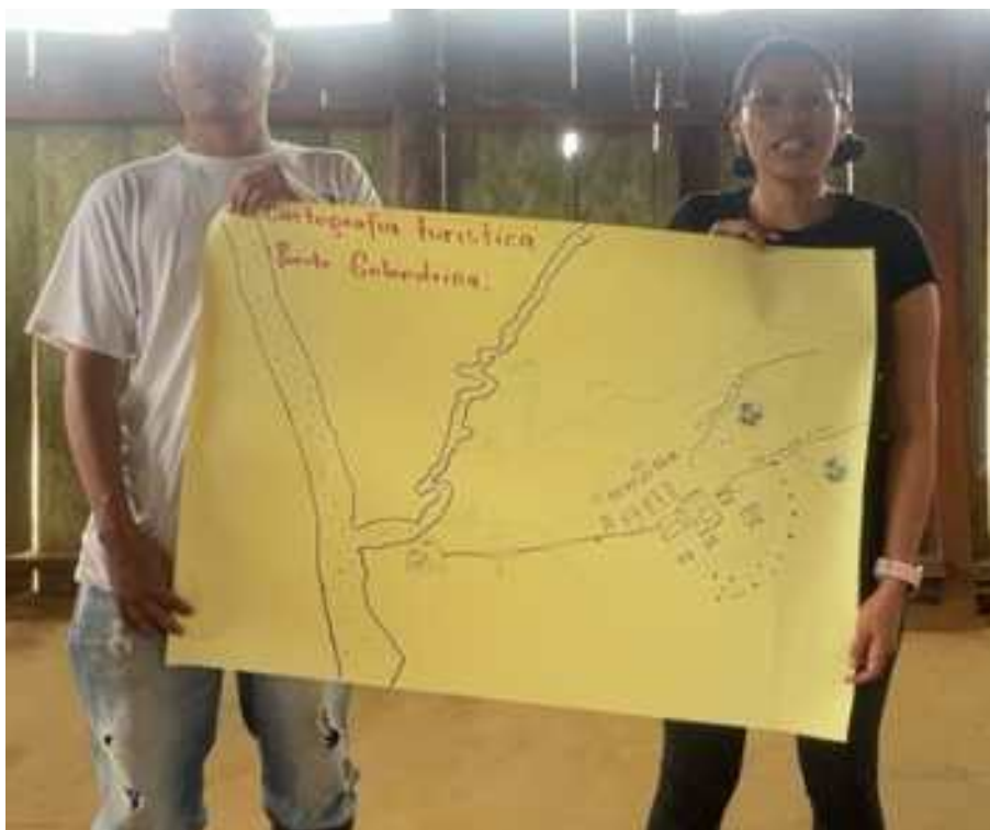
Imagen 1. Cartografía social turística

15/11/2026, Comunidad Puerto Golondrina