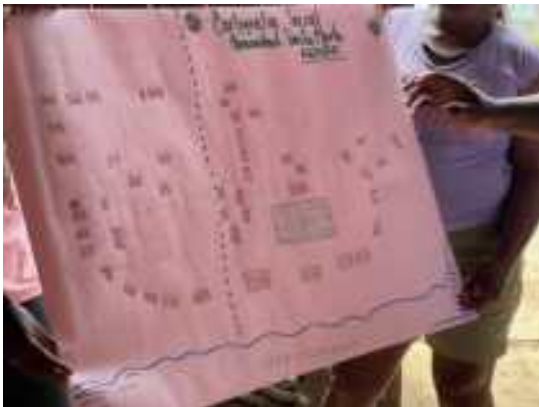
Imagen 1. Cartografía social turística

Tomada por Zaiza Rodríguez: 16/11/2026, Comunidad Santa Marta