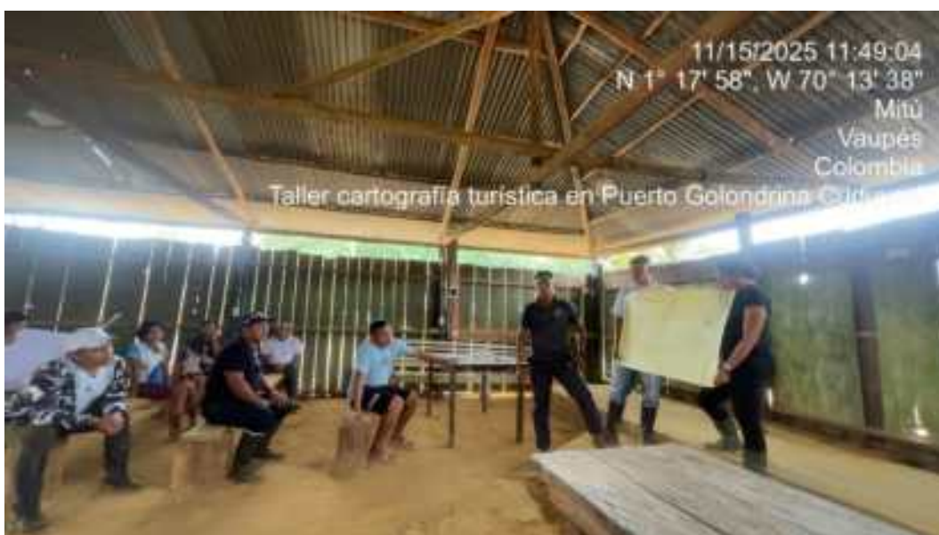
Imagen 2. Socialización Cartografía y saberes locales sobre los recursos localizados

Tomada por Zaiza Rodríguez: 15/11/2026, Comunidad Puerto Golondrina