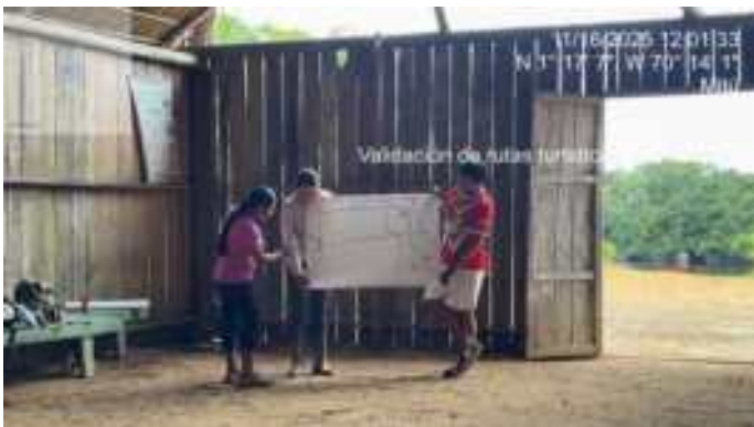
Imagen 2. Socialización Cartografía y saberes locales sobre los recursos localizados

16/11/2026, Comunidad Santa Marta